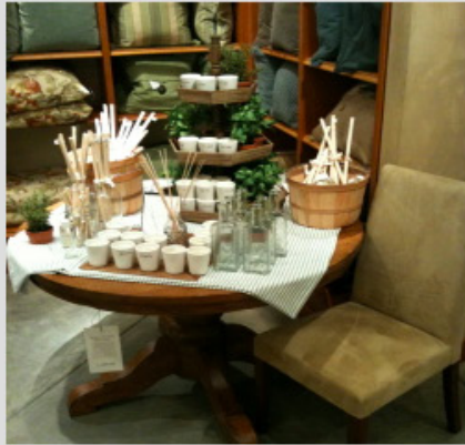
Tische, auf denen diverse Anbieter ihre Ware ausstellen können - vom der Tischdecke bis hin zur Blumendeko. Man mietet "Quadratmeter" auf dem Tisch.

Hier Beispiele für die geplanten Flächen - wir stellen alles bereit, Ihr könnt für ganz wenig Geld die Art von Ausstellung Eurer Waren buchen, die am Besten passt (macht Vorschläge, wenn Ihr eine Ausstellungsartwünscht, die bisher nicht geplant ist. Was möglich ist, machen wir!):