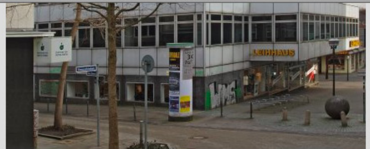
Das künftige Panorama-Coworking im 5. Stock des GeKu-Hauses, City Essen, Fußgängerzone - Eröffnung voraussichtlich Juli 2011.

Die Fassade wird begrünt und mit einigen Balkonen versehen. Die Coworker bekommen eine lichtdurchflutete im Stil einer Gartenlandschaft gestaltete Etage mit Blick über Essen und eigener Dachterrasse.