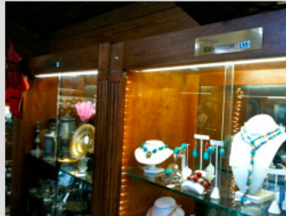
Glasvitrinen, in denen man einzelne Fächer mietet und dort für wenig Geld seine Ware ausstellen kann. Man mietet Fächer in den Glasvitrinen.